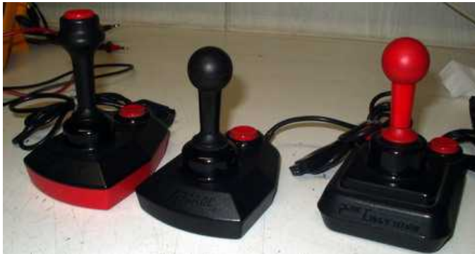
Verskillende Arcade Joysticks

Er zijn diverse soorten Arcade Joysticks van Suzo. Voor de MSX computer zijn dit de beste Joysticks en zeker de versies met twee onafhankelijke vuurknoppen. Na vele uren speelplezier kan het gebeuren dat de Joystick niet meer goed werkt. Echter zijn deze Joysticks eenvoudig te repareren.