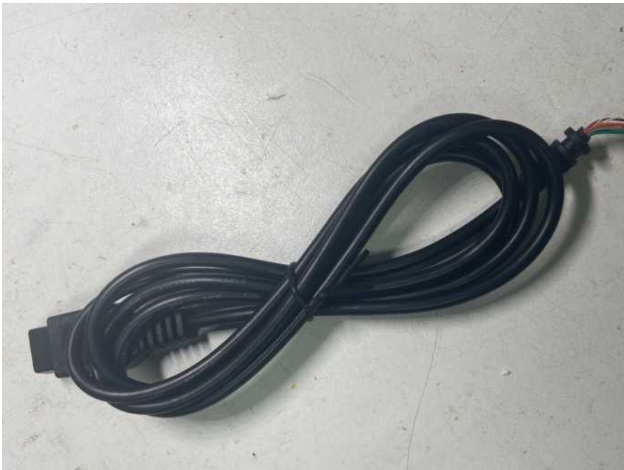
De nieuwe kabel

Op een website als AliExpress of Ebay kun je eenvoudig kabels kopen. Dit zijn Sega Joypad kabels.