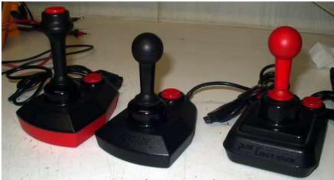
Verschillende Arcade Joysticks

Er zijn diverse soorten Arcade Joysticks van Suzo. Voor de MSX computer zijn dit de beste Joysticks en zeker de versies met twee onafhankelijke vuurknoppen. Na vele uren speelplezier kan het gebeuren dat de Joystick niet meer goed werkt. Echter zijn deze Joysticks eenvoudig te repareren.