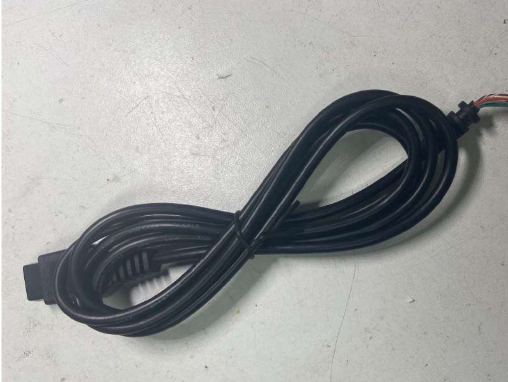
De nieuwe kabel