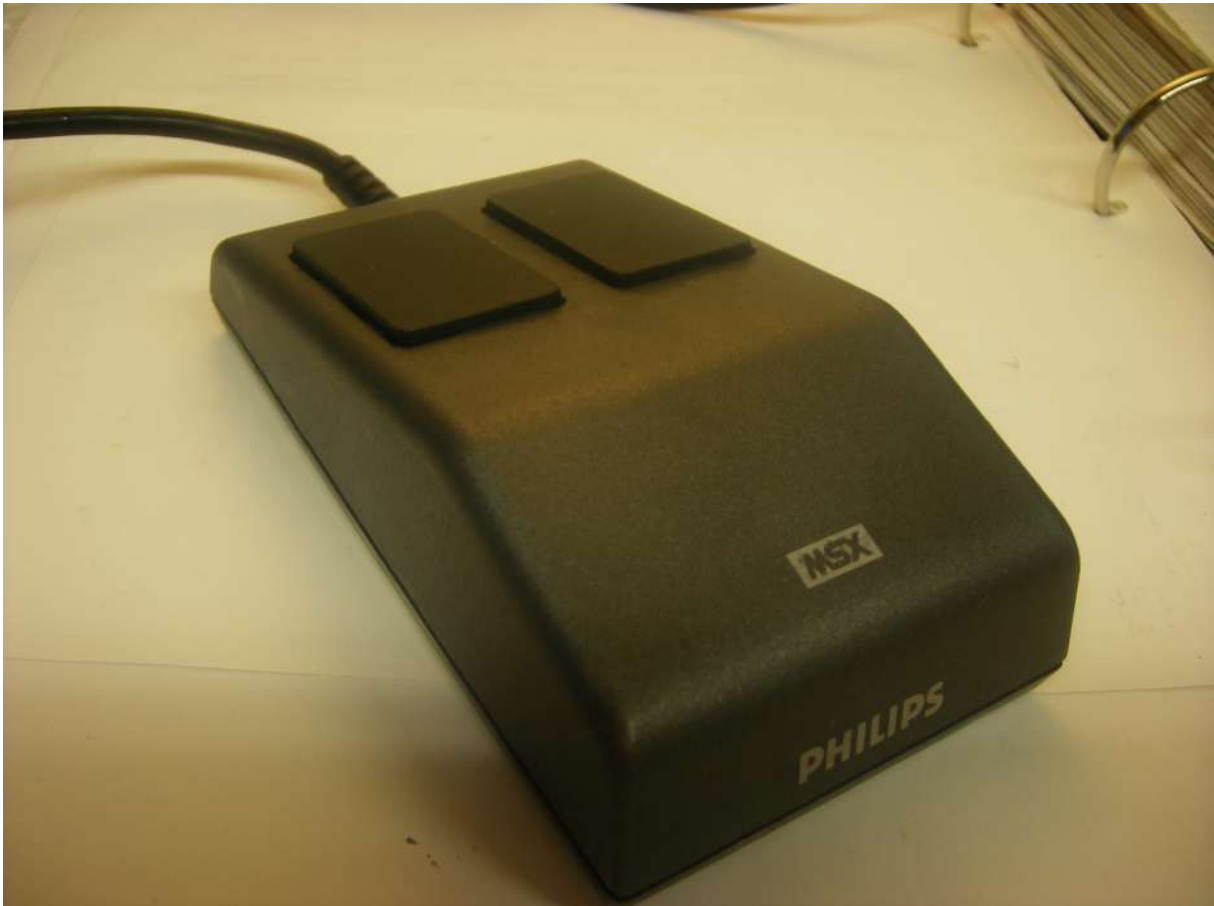
De Philips NMS 1140 muis

Regelmatig komt het voor dat de muis niet meer werkt. In de meeste gevallen is het schoonmaken van de geleidewieltjes de oplossing. Maar een kabelbreuk komt ook regelmatig voor, echter de originele kabels zijn niet meer te verkrijgen. In plaats van de originele kabel kun je ook een joystickkabel nemen met 9 aders. Op een website als AliExpress of Ebay kun je eenvoudig kabels kopen. Dit zijn Sega Joypad kabels.